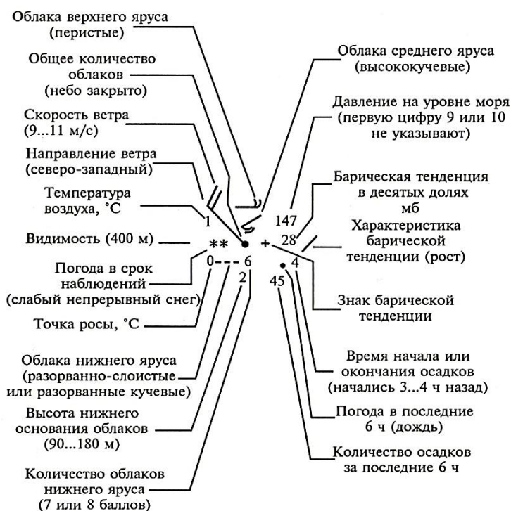
Рис. 6.2. Схема нанесения данных на синоптическую карту

статочно объективно провести на карте соответствующие фронтальные разделы воздушных масс. Их обычно изображают особыми линиями: холодный фронт – линией с треугольниками, обращенными в сторону перемещения фронта; теплый фронт – линией, на которой полукружки направлены также в стороны его движения; на линии фронта окклюзии треугольники и кружки чередуются. На карте также выделяют пункты и зоны с опасными явлениями, такими как грозы или туман, заморозки и т.п.