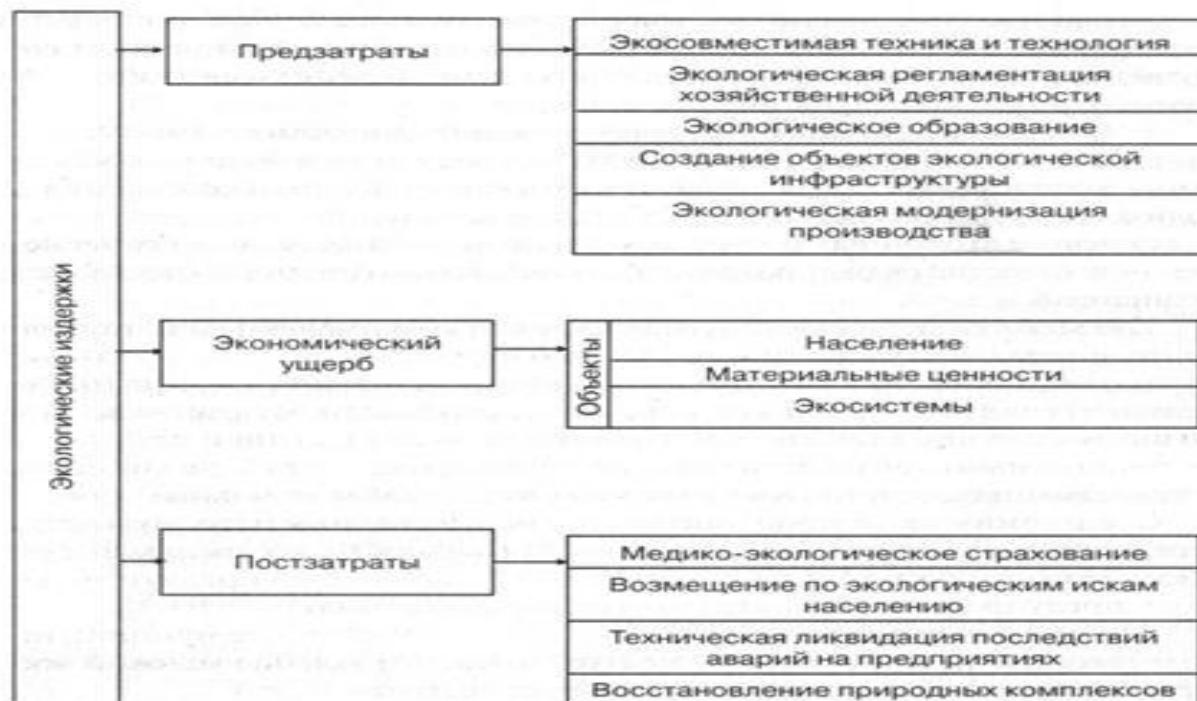
Рис. 3.4. Структура экологических издержек

С точки зрения практики определение величины природоохранных издержек – задача сама по себе не совсем простая и, хотя она существенно проще, чем оценка ущерба, тем не менее, возникает ряд непростых вопросов. Например, замена технологии, с одной стороны – ее применение может быть сопряжено с получением дополнительной прибыли.