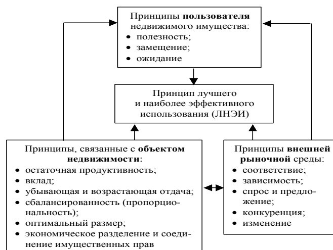
Рис. 1. Принципы оценки недвижимости

Процесс оценки – это последовательность действий, выполняемых в ходе определения стоимости. Процесс оценки обычно включает несколько этапов: