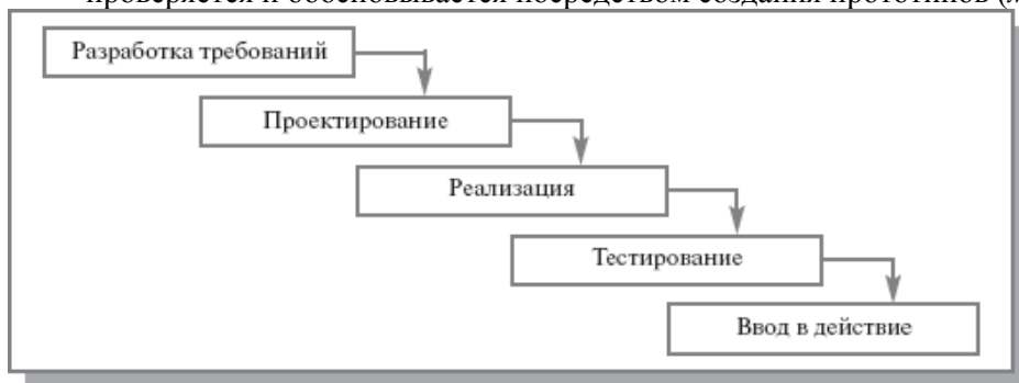
Рис. 2.1. Каскадная модель ЖЦ ИС