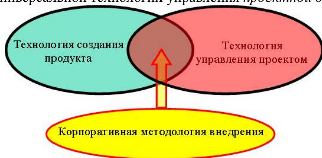
Рис. 1.2. Составляющие методологии внедрения

Таким образом, методология внедрения строится как пересечение двух различных областей знаний: специфической технологии создания продукта - информационной системы - и достаточно универсальной технологии управления проектной деятельностью ( рис. 1.2 ).