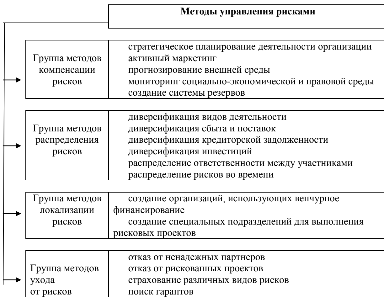
Рис. 1. Методы управления рисками