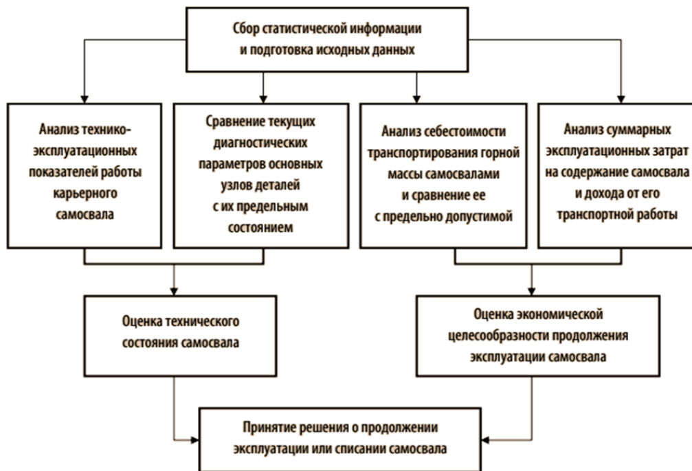
Рис. 1. Структура методики определения продолжения эксплуатации или списания карьерного самосвала

Функциональным критерием использования самосвалов является производительность, на которую непосредственно влияют техническое состояние машин и внешние факторы (климатические условия, организация производства и т.д.). Так как в настоящее время коэффициент использования во времени, определяется отношением числа выходящих на линию самосвалов к их инвентарному парку и характеризует степень использования парка в целом, то при оценке рационального срока эксплуатации конкретного самосвала учитывать его в расчете производительности некорректно. В свою очередь, коэффициент технической готовности, который определяется отношением разницы времени нахождения самосвала в хозяйстве и времени нахождения самосвала в техническом обслуживании и ремонте к времени нахождения самосвала в хозяйстве, не позволяет провести полный анализ простоев и использования самосвала во времени.