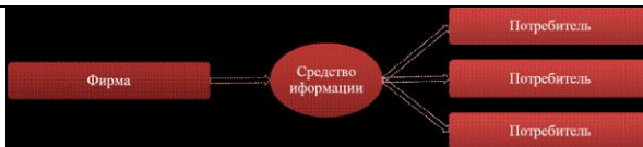
Рисунок 1. Модель коммуникационных процессов традиционных СМИ

В основе коммуникационной модели традиционных СМИ лежит процесс «один ко многим», при котором фирма передает информацию группе потребителей, используя средство коммуникации. Главной особенностью, лежащей в основе взаимодействия традиционных средств массовой информации с потребителями, является отсутствие интерактивного взаимодействия.