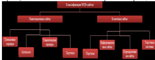
Рисунок 1. Классификация web-сайтов

Публикации во Всемирной паутине реализуются в форме Web-сайтов, общую классификацию которых можно представить в виде схемы, изображенной на рисунке 1. Web-сайт по своей структуре напоминает журнал, который содержит информацию, посвященную какой-либо теме или проблеме. Как журнал состоит из печатных страниц, так и Web-сайт состоит из компьютерных Web-страниц.