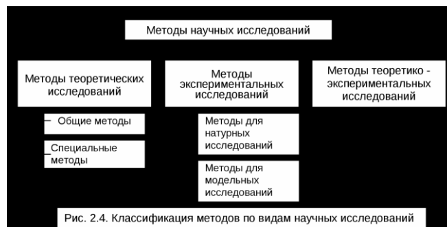
Рис. 2.4. Классификация методов по видам научных исследований

Научные исследования условно можно разделить на три основных класса: теоретические; экспериментальные; теоретико - экспериментальные. Соответственно делятся и методы для проведения этих исследований (рис. 2.4). При проведении теоретических исследований используют большое количество разных методов. Общими из них для любых исследований являются: методы дедукции и индукции, анализ и синтез, метод обобщения, метод абстрагирования, метод формализации, метод моделирования и прочие. Экспериментальные исследования делятся на натурные и модельные. Теоретико-экспериментальные исследования выполняются, как правило, с помощью как теоретических, так и экспериментальных методов.